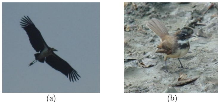
Gambar 3. a. Bangau tongtong ( Leptoptilos javanicus ), b. Kipasan belang ( Rhipidura javanica )

Selain itu juga terdapat beberapa jenis burung yang sedikit dijumpai di kawasan Hutan Mangrove Banyuurip Ujungpangkah Gresik, yaitu bangau tongtong ( Leptoptilos javanicus ), Kipasan belang ( Rhipidura javanica ) (Gambar 3), trinil rawa ( Tringa stagnatilis ), dan remetek laut ( Gerygone sulphurea ) dengan nilai kelimpahan relatif sebesar 0,04%.