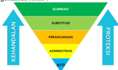
Gambar 1. Hierarki pengendalian risiko K3

Langkah penting dalam menetapkan keseluruhan manajemen risiko adalah pengendalian risiko. Pengendalian risiko memiliki peran penting dalam mengurangi tingkat risiko dari tingkat tertinggi hingga tingkat terendah atau pada tingkat yang dapat diterima. Berikut Hierarki pengendalian risiko :