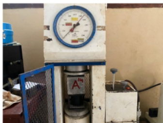
Gambar 2. Set up alat pengujian kuat tekan

Berikut set up pengujian kuat tekan menggunakan alat Compression Testing Machine :