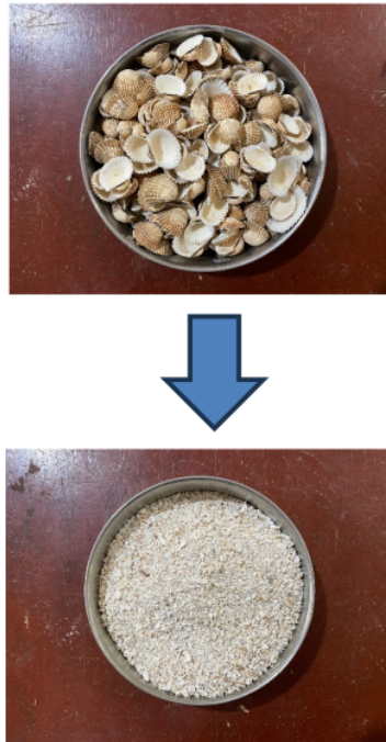
Gambar 3. Cangkang Kerang Yang Telah di Hancurkan

substitusi cangkang kerang anadara granosa sebesar 0%, 2.5%, 5%, 30%, dan 10%. Untuk contoh material kerang yang digunakan dapat dilihat pada gambar 3.