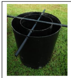
Gambar 2. Infiltrometer Cincin Ganda

Uji infiltrasi dilakukan di 14 titik lokasi. Adapun pengukuran laju infiltrasi dilakukan memakai alat Infiltrometer cincin ganda dengan tinggi 50 cm, cincin dalam berdiameter 30 cm, dan cincin luar berdiameter 45 cm. terbuat dari baja dengan tebal 3 mm dengan ujung bawah di runcingkan.