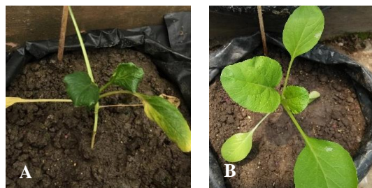
Gambar 3. Morfologi Tanaman Sawi Hijau Setelah Perlakuan Logam Cd: (A) Kontrol (Tanpa MVA dan Si), dan (B) Penambahan MVA dan Si

Berdasarkan hasil pengamatan pada daun yang tidak diberikan MVA dan Si ( Gambar 3 ), menunjukkan gejala daun menjadi melengkung dan mengecil serta mengalami klorosis. Sedangkan pada daun yang diberikan MVA dan Si, daun berwarna hijau dan tidak mengalami gejala seperti daun yang tidak diberikan MVA dan Si.