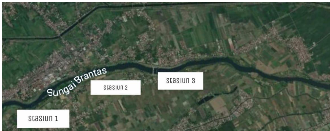
Gambar 1. Peta pengambilan sampel

Parameter penelitian yang digunakan yaitu diversitas dan densitas tumbuhan akuatik terapung, kadar logam berat Pb pada tumbuhan akuatik terapung dan air sungai, serta faktor fisik dan kimia perairan (suhu, pH, kadar oksigen terlarut dan BOD). Identifikasi dan pencacahan spesies tumbuhan akuatik terapung dan pengukuran parameter perairan (suhu, pH, dan kadar oksigen terlarut) dilakukan secara in situ di tiap stasiun di Sungai Brantas, dan pengukuran BOD dilakukan di Lab. Ekologi, Jurusan Biologi FMIPA, UNESA. Analisis kadar timbal (Pb) tumbuhan akuatik terapung dan air Sungai Brantas diobservasi di Baristan Surabaya menggunakan metode Atomic Absorbstion Spectrophotometric (AAS) menggunakan Spektofotometer Thermo ICE 2000. Lokasi stasiun pengamatan dan pengambilan sampel tumbuhan akuatik terapung dan sampel air sungai pada tiga stasiun di Sungai Brantas seperti peta pada Gambar 1 .