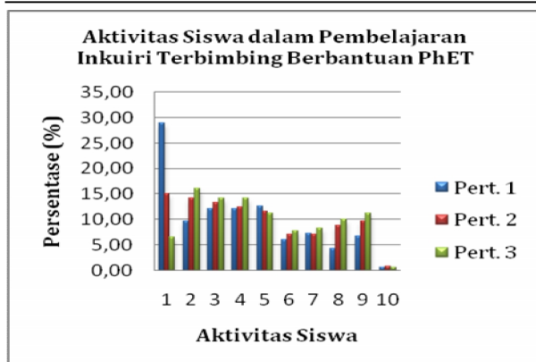
Gambar 2. Persentase Aktivitas Siswa

Berdasarkan diagram batang tentang persentase aktivitas siswa dalam KBM, dapat dikemukakan bahwa persentase aktivitas yang dominan dilakukan siswa adalah membaca (mencari informasi tentang materi yang sedang dipelajari, yaitu 16,82%). Aktivitas yang dilakukan siswa tersebut menunjukkan bahwa rasa ingin tahu siswa terhadap materi listrik dinamis tinggi. Hal ini memberikan kesempatan kepada siswa untuk aktif dalam menemukan konsep dan berlatih berpikir kritis untuk menemukan hubungan dan membuat kesimpulan berdasarkan data eksperimennya. Sesuai dengan tujuan Kurikulum 2013 untuk menghasilkan peserta didik sebagai manusia yang mandiri dan tak berhenti belajar, proses pembelajaran dalam RPP dirancang berpusat pada peserta didik untuk mengembangkan motivasi, rasa ingin tahu, kreativitas, kemandirian, keterampilan belajar dan mendorong partisipasi aktif peserta didik (Permendikbud No. 81A).