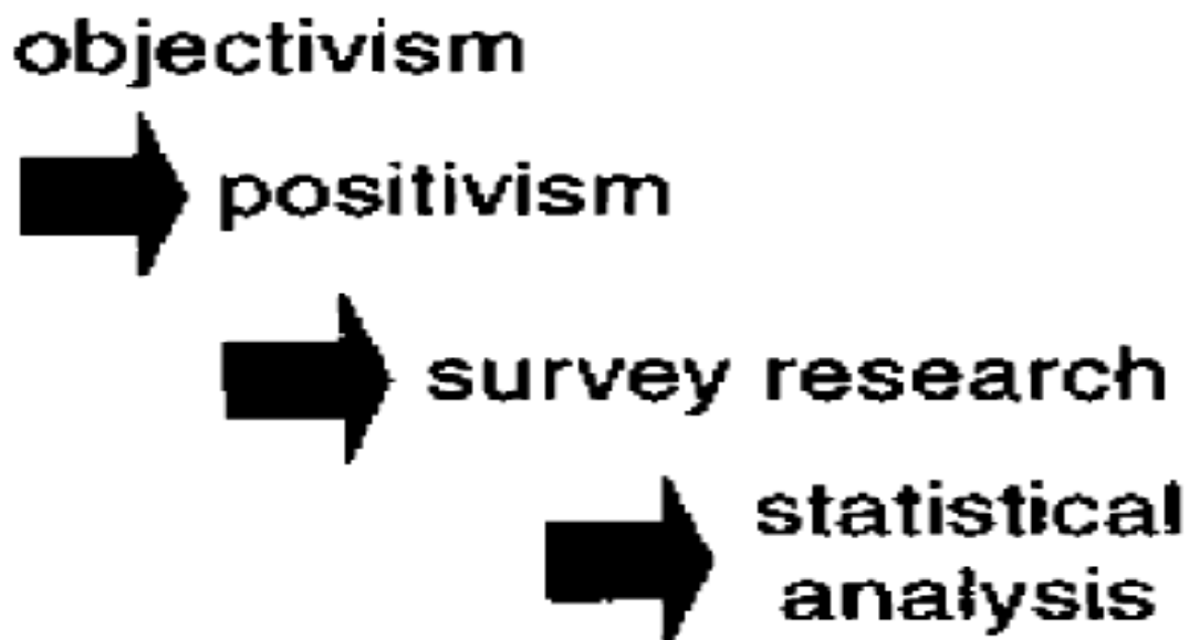
Gambar 4. Contoh Penerapan 4 Elemen (Crotty, 1998: 7)

Kedua gambar di atas mengilustrasikan tentang bagaimana dua paradigma dalam epistemologi difungsikan sebagai penentu sudut pandang teoritis, metodologi serta metode dalam penelitian. Contoh pertama [Gambar 3] yaitu konstruksionisme yang menggunakan pendekatan interaksi simbolik. Etnografi digunakan sebagai metodologi dan observasi partisipatif sebagai metode penelitiannya. Contoh kedua [Gambar 4] yaitu objektivisme yang menggunakan sudut pandang positivisme. Dengan menggunakan metode analisis statistik, penelitian dengan basis epistemologi ini bermetodologi penelitian survey.