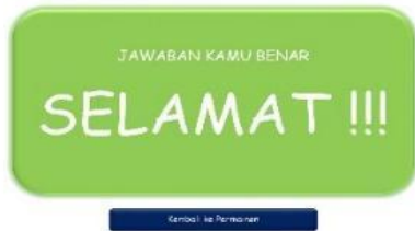
Gambar 6. Tampilan Jawaban Benar

Pada tampilan pengumuman terdapat 5 pengumuman yaitu yang pertama saat siswa menjawab pertanyaan dengan benar, menjawab pertanyaan dengan salah, saat bertemu dengan ular, saat bertemu dengan tangga, dan saat menyelesaikan permainan. Contoh tampilan saat benar menjawab dan saat menyelesaikan permainan seperti pada Gambar 6 dan 7.