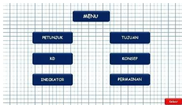
Gambar 2. Tampilan Menu Utama

Pada tampilan selanjutnya terdapat halaman terkait menu yang ada pada permainan seperti tombol petunjuk, KD, indikator, tujuan, konsep, dan permainan. Dalam menu tersebut setiap tombol akan mengarahkan kepada halaman yang diinginkan dan untuk kembali pada menu dapat dilakukan dengan menekan tombol kembali yang ada pada pojok kanan bawah. Contoh tampilan menu utama seperti pada Gambar 2 dan contoh tampilan menu tambahan dalam permainan seperti pada Gambar 3.