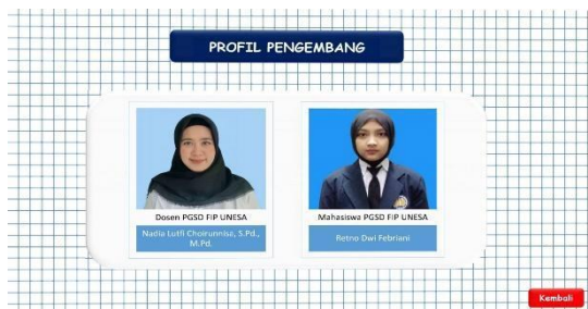
Gambar 8. Tampilan Profil Pengembang

Pada tampilan penutup terdiri dari ucapan terima kasih, profil pengembang, dan daftar pustaka. Contoh tampilan profil pengembang yang berisi biodata pengembang seperti pada Gambar 8.