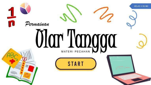
Gambar 1. Tampilan Cover

Pada halaman pembuka terdapat cover yang berisi informasi terkait permainan seperti judul, topik, dan kelas seperti pada Gambar 1.