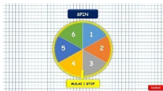
Gambar 4. Tampilan Spin

Selanjutnya tampilan pada permainan yang berisi tombol mulai, peraturan, dan tutorial. Pada tombol mulai berisi halaman spin, tombol peraturan berisi beberapa peraturan yang harus dilaksanakan siswa, dan tombol tutorial berisi beberapa tata cara pelaksanaan serta video tutorial. Dalam tampilan ini juga terdapat pertanyaan dan pembahasan. Contoh tampilan spin dan pertanyaan seperti pada Gambar 4 dan Gambar 5.