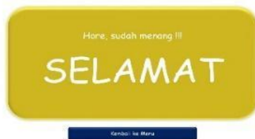
Gambar 7. Tampilan Menyelesaikan Permainan

Pada tampilan penutup terdiri dari ucapan terima kasih, profil pengembang, dan daftar pustaka. Contoh tampilan profil pengembang yang berisi biodata pengembang seperti pada Gambar 8.