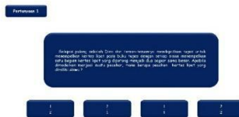
Gambar 5. Tampilan Pertanyaan