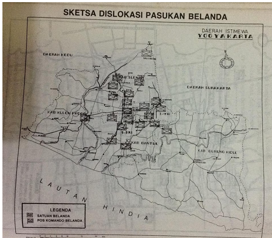
Gambar 4. Sketsa diskolasi pasukan Belanda di Yogyakarta (Sumber: Seskoad TNI AD, 1990).

perspektif taktik militer, Serangan Umum 1 Maret menunjukkan penerapan prinsip kejutan strategis ( strategic surprise ) dan penguasaan inisiatif tempur ( offensive initiative ). Pasukan TNI tidak bermaksud mempertahankan wilayah dalam jangka panjang, melainkan menciptakan dampak psikologis dan politis yang besar. Serangan kilat ini berhasil mengguncang moral pasukan Belanda sekaligus mengirim pesan kepada dunia internasional bahwa Republik Indonesia masih memiliki kekuatan terorganisir. Secara militer, tindakan ini juga berfungsi sebagai pembuktian efektivitas strategi mobile warfare , di mana kecepatan, fleksibilitas, dan komunikasi menjadi faktor utama keberhasilan operasi (Iman et al., 2023).