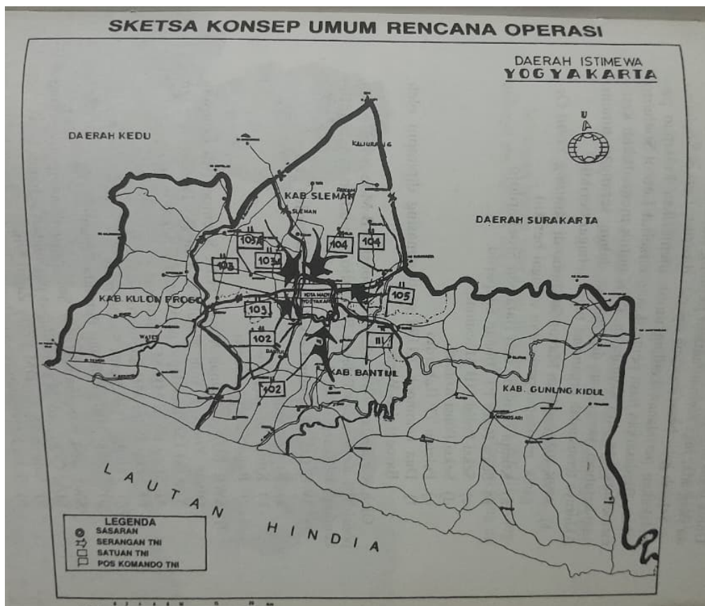
Gambar 3. Sketsa konsep umum rencana operasi Serangan Umum 1 Maret 1949 dari semua sektor SWK 101, SWK 102, SWK 103, SWK 103A, SWK 104, SWK 105, dan SWK 106 (Sumber: Seskoad TNI AD, 1990).

Letkol Soeharto, selaku Komandan Wehrkreise III, memimpin langsung perencanaan operasi yang berlangsung secara rahasia dan terorganisasi. Rencana serangan disusun melalui koordinasi antara berbagai sektor komando, meliputi sektor barat, timur, utara, dan selatan kota Yogyakarta. Setiap sektor memiliki tugas spesifik untuk menutup jalur komunikasi dan mobilisasi pasukan Belanda. Strategi penyerangan dilakukan pada pukul 06.00 pagi, saat situasi relatif tenang dan pasukan Belanda tidak menduga adanya operasi besar. Serangan serentak ini berlangsung selama kurang lebih enam jam dan berhasil menguasai pusat kota, termasuk titik-titik strategis seperti Tugu Pal Putih, Malioboro, dan Gedung Agung (Hilal et al., 2022).