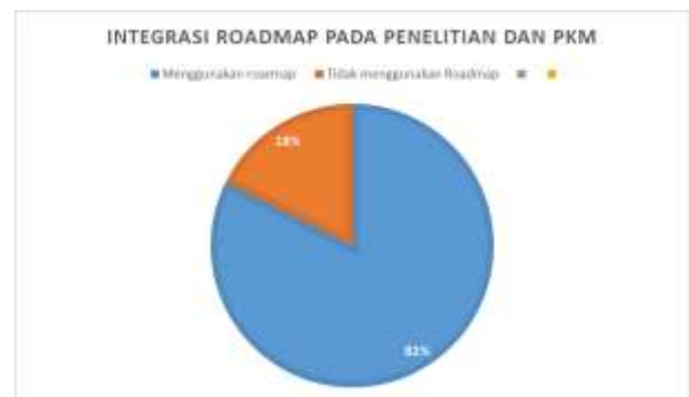
Diagram 2. Pemahaman roadmap

Topik dalam penelitian merupakan sebuah hal yang sangat penting. Terlebih penelitian tersebut berangkat dari seorang peneliti atau dosen dalam sebuah institusi. Dalam proses pelaksanaannya, pribadi dosen tersebut tentu memiliki kepakaran serta minat dalam sebuah penelitian yang akan dikerjakan. Lain pihak sebuah institusi yang menaungi peneliti tersebut juga memiliki tujuan tersendiri yang ingin dicapai. Dalam proses ini akhirnya akan dicapai sebuah jalan keluar yang diharapkan dapat menguntungkan kedua belah pihak. Salah satu bukti nyata dari usaha pemersatu tersebut ialah apa yang disebut roadmap atau peta jalan, dari penelitian maupun pengabdian kepada masyarakat. Roadmap penelitian dan PKM program studi merupakan sebuah hal yang akan menguntungkan peneliti atau dosen juga dengan institusi yang menaungi, terlebih dapat menunjukkan dengan jelas arah topik dari penelitian dan pkm.