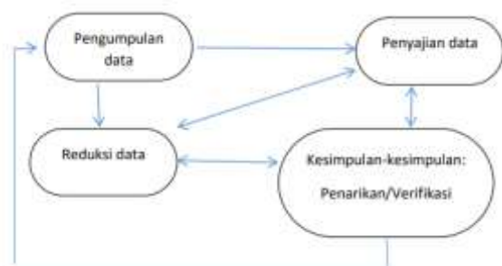
Gambar 1. Siklus Penelitian Kualitatif

Prosedur pengumpulan data meliputi wawancara semi-terstruktur. Teknik wawancara ini dianggap lebih efektif dalam keberhasilan pengambilan data. Hal ini dikarenakan jawaban yang diberikan lebih bersifat terbuka. Kamaria (2021) menyatakan bahwa wawancara terstruktur dirasa lebih bebas bila dibandingkan dengan jenis wawancara lainnya karena hasil dari wawancara ini kerap kali mampu menemukan permasalahan yang sebenarnya terjadi, sebab responden mampu menjawab pertanyaan dengan terbuka dan dengan bebas memberikan pendapat dan ide-idenya secara natural (Kamaria, 2021).