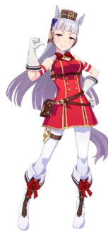
Gambar 2. Karakter Goldship dalam kostum balap

Desain kostum Gold Ship didominasi warna merah, putih, emas, dan cokelat yang menciptakan tampilan mencolok sekaligus mewah. Bagian atas kostum berupa dress tanpa lengan berwarna merah dengan detail garis emas, kancing dekoratif, kerah putih, dan pita merah besar di bagian leher. Selain itu, terdapat aksesoris menyerupai perlengkapan kuda berupa tali halter dan ornamen logam yang memperkuat identitas visual karakter. Bagian bawah terdiri atas legging putih bermotif serta sepatu boots tinggi beraksen emas. Komposisi visual menempatkan wajah sebagai pusat perhatian, sementara rambut, telinga kuda, dan alur kostum membentuk kesan gerak yang dinamis. Detail tekstur pada kain, aksesoris, dan ekor kuda turut memperkuat dimensi visual karakter. Secara keseluruhan, tampilan Gold Ship memperlihatkan perpaduan unsur gadis kuda, kostum balap, dan elemen idol Jepang yang membentuk identitas visual unik dan ekspresif.