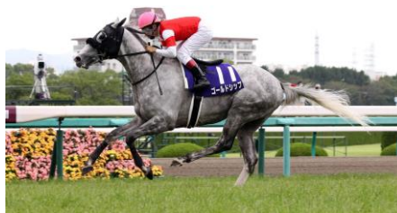
Gambar 3. Foto kuda Gold Ship nyata di lintasan Arima Kinen/Takarazuka

Pada konteks historisnya, karakter Gold Ship dalam Umamusume: Pretty Derby diadaptasi dari kuda pacu asli Jepang bernama Gold Ship, seekor thoroughbred kelahiran 31 Maret 2009 yang dikenal sebagai salah satu kuda balap jarak menengah hingga jauh paling berprestasi di generasinya. Selama karier balapnya, Gold Ship mencatatkan berbagai kemenangan bergengsi, termasuk enam gelar G1 seperti Satsuki Shō , Kikuka Shō , Arima Kinen , Takarazuka Kinen , dan Tenno Sho (Spring) . Prestasi tersebut menjadikan Gold Ship memiliki citra sebagai kuda juara dengan kemampuan kompetitif yang tinggi. Namun, di balik pencapaiannya, Gold Ship juga dikenal memiliki temperamen yang tidak stabil dan sulit diprediksi, seperti perilaku gelisah di gerbang start maupun performa balapan yang berubah-ubah. Karakteristik tersebut kemudian diterjemahkan ke dalam versi Umamusume sebagai sosok gadis yang eksentrik, jahil, spontan, tetapi tetap memiliki kemampuan balap yang unggul.