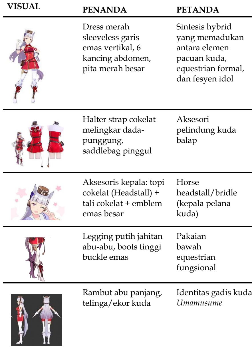
Tabel 1. Analisis tataran pertama kostum Gold Ship

Pada tataran pertama, hubungan penanda dan petanda menghasilkan makna literal yang eksplisit dan disepakati secara sosial dari elemen visual kostum Gold Ship.