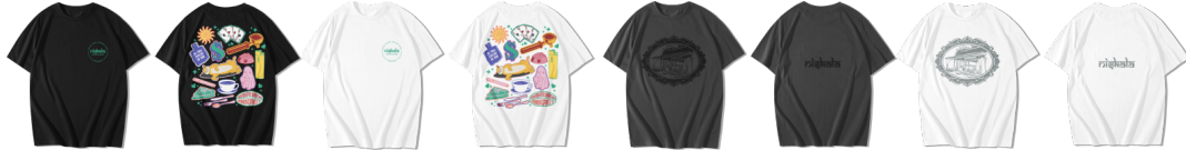
Gambar 22. Kaos Niskala Coffee & Space