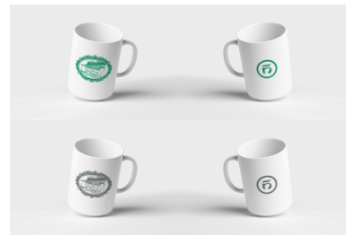
Gambar 24. Mug Niskala Coffee & Space