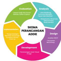
Gambar 1. Skema Perancangan ADDIE

Prosedur perancangan dalam penelitian ini mengacu pada metode R&D ( Research & Development ) model pengembangan ADDIE, yaitu Analysis, Design, Development, Implementation, dan Evaluation (Da'on & Hendri, 2023). Terdapat empat tingkat penelitian dan pengembangan dimulai dari penelitian untuk mendapatkan hasil rancangan hingga untuk menciptakan produk baru dan melakukan uji efektivitas produknya (Okpatrioka Okpatrioka, 2023). Perancangan dilakukan sampai tahap menciptakan produk baru dengan hasil identitas visual baru Niskala Coffee & Space beserta uji efektivitas logonya.