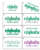
Gambar 13. Kesalahan Penerapan Logo Niskala Coffee & Space