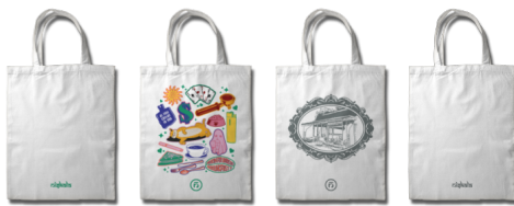
Gambar 23. Tote Bag Niskala Coffee & Space