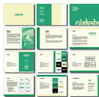
Gambar 27. Penjabaran GSM Niskala Coffee & Space