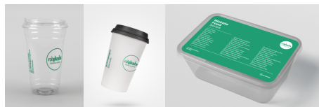
Gambar 15. Label Kemasan take away Niskala Coffee & Space

Setelah kerangka desain label kemasan telah disepakati dan sesuai lanjut pada proses desain label kemasan take away Niskala Coffee & Space. Desain label kemasan dibuat dengan penggabungan elemen visual seperti logo, font , warna, dan elemen visual pendukung lain.