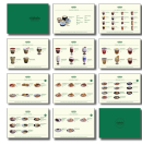
Gambar 19. Menu Digital Niskala Coffee & Space