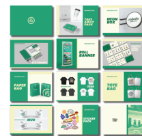
Gambar 28. Penerapan GSM Niskala Coffee & Space