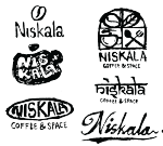
Gambar 3. Sketsa Desain Logo Niskala Coffee & Space