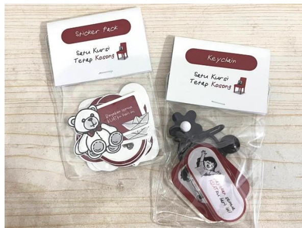
Gambar 11. Merchandise