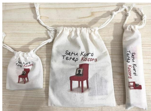
Gambar 8. Pouch Belacu (Sumber : Ruthsania, 2026)