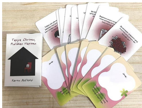
Gambar 12. Kartu Refleksi