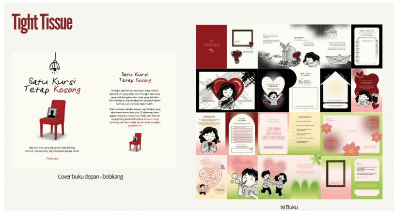
Gambar 5. Tissue Tissue