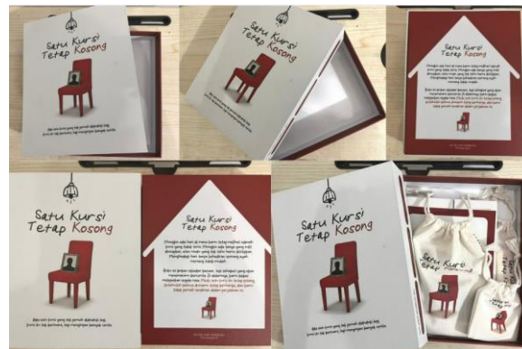
Gambar 7. Packaging