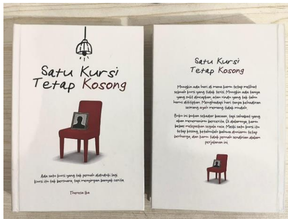
Gambar 6. Buku Interaktif