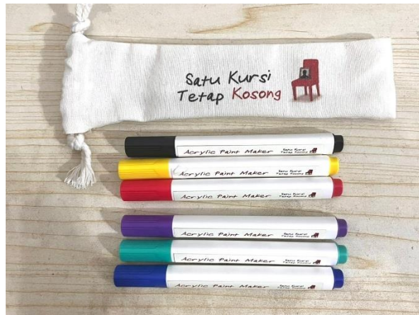
Gambar 10. Acrylic Paint Maker