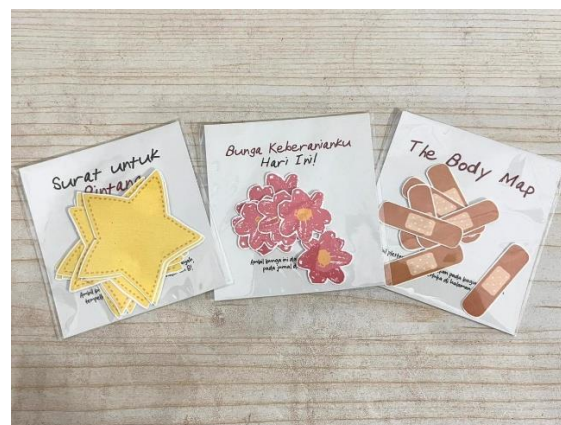
Gambar 9. Sticker Interaktif