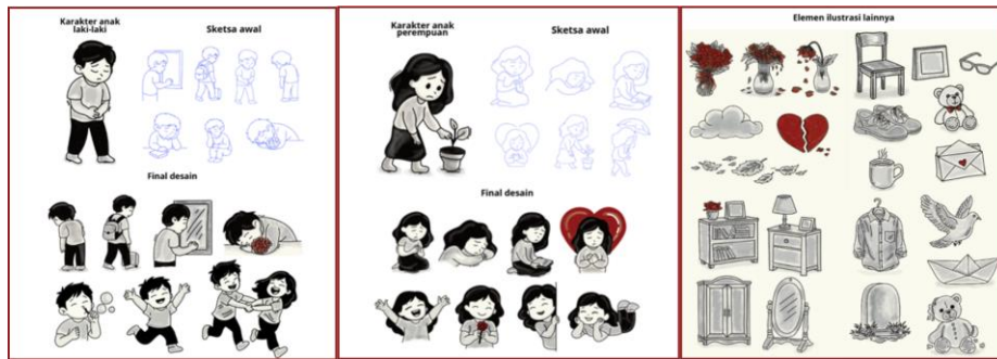
Gambar 3. Ilustrasi

Gaya ilustrasi yang digunakan adalah ilustrasi sketsa. Figur anak perempuan dan anak laki-laki sebagai representasi dari Inner Child , yaitu sisi diri yang menyimpan pengalaman emosional masa kecil, khususnya terkait kehilangan atau ketiadaan peran ayah. Dalam konteks bahasa visual, karakter anak dirancang dengan pendekatan stilasi bentuk, proporsi yang cenderung imut, serta garis lembut untuk menciptakan kesan rentan, polos, dan jujur secara emosional. Adapun elemen pendukung sebagai representasi suasana rumah dan memori yang berkaitan dengan kehadiran maupun ketidakhadiran sosok ayah.