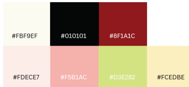
Gambar 1. Tone Warna

Tone warna yang digunakan adalah tone warna gelap dan tone warna cerah. Dimana tone warna gelap memvisualisasikan rasa kehilangan, kesedihan, dan perasaan berat yang dirasakan oleh pembaca dalam menghadapi permasalahannya, sedangkan untuk tone warna cerah memvisualisasikan dimana pembaca memiliki harapan, refleksi positif, perasaan untuk bangkit atau resiliensi, dan keberanian untuk keluar dari keterpurukan.