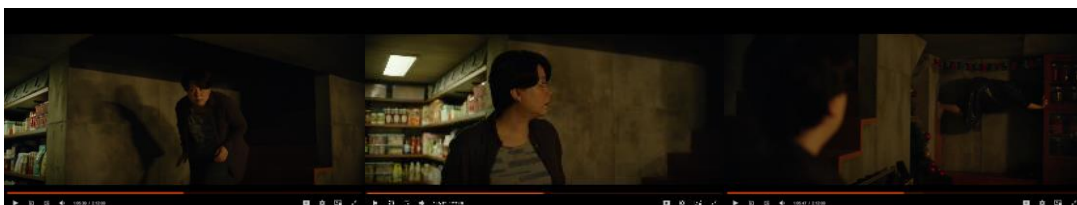
Gambar 4 Penemuan bunker bawah tanah

Adegan keempat dimana penemuan suami Moon gwang di bunker bawah tanah. Pada adegan bunker membuka konflik lapisan kelas bawah yang saling berebut tempat. Secara simbolik bunker rahasia memperluas ruang kelas sosial secara vertikal, digambarkan jika rumah mewah Park adalah struktur kelas paling atas, kemudian basement keluarga Kim bagian kelas tengah kebawah, dan bunker rahasia merupakan kelas sosial paling bawah yang bahkan tidak disadari keberadaannya. Ketika keluarga Kim menemukan bunker rahasia Moon Gwang, ditemukan juga realitas brutal akan konflik dan kompetisi antar kelas yang tidak berujung, bahkan konflik diantara kelompok tertindas. Framing gelap dengan sudut kamera sempit menciptakan suasana tertekan dan tidak stabil. Adegan ini memperluas representasi kelas sosial dengan menampilkan lapisan masyarakat yang lebih terpinggirkan. Sinematografi pada adegan ini menegaskan pandangan Bazin mengenai realitas tersembunyi yang dapat diungkap melalui medium film.