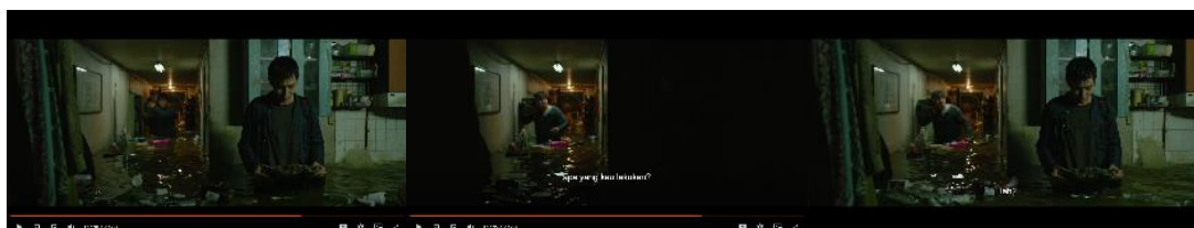
Gambar 5 Banjir dibasement keluarga Kim

Adegan kelima menceritakan tentang adegan banjir basement keluarga Kim. Banjir secara literal menandakan bahwa keluarga Kim tinggal ditempat yang rendah secara sosial dan topografis, dengan kondisi ruang yang paling mudah terendam dan hancur. Situasi banjir menunjukkan bahwa kondisi kelas bawah rentan terkena bencana urban. Adegan ke empat ini juga menunjukkan titik rapuh dalam diri Kim, yang kemudian mempengaruhi tindakannya. Adegan dimana Ki Woo memegang Schollar Rock's atau batu harapan yang mengapung, dan diikuti dengan berkedipnya pijaran lampu meberikan isyarat bahwa semua harapan dan keberuntungan keluarga Kim akan berakhir. Pada shot tersebut menggunakan camera movement static dan juga camera angle eye level untuk memperlihatkan detail situasi yang terjadi dan mengajak penonton merasakan ketegangan keluarga Kim.