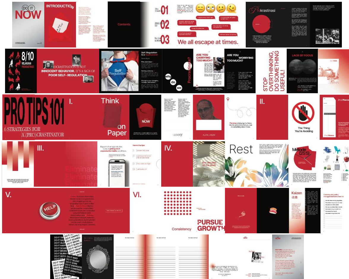
Gambar 5. Hasil Akhir Buku Jurnal Interaktif “DO IT NOW”

untuk melakukan journaling berdasarkan pengalaman dan perasaan yang dirasakan setelah membaca buku ini.