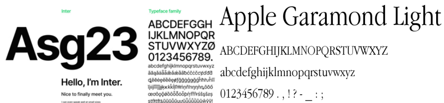
Gambar 4. Typeface Inter & Apple Garamond

Tipografi menggunakan kombinasi Inter (sans-serif) sebagai huruf utama untuk body text karena tingkat keterbacaannya yang tinggi, dan Apple Garamond (serif) sebagai tipografi pendukung pada elemen judul dan bagian reflektif untuk menghadirkan nuansa personal dan humanis. Perpaduan keduanya menciptakan hierarki visual yang seimbang antara kesan modern dan kontemplatif.