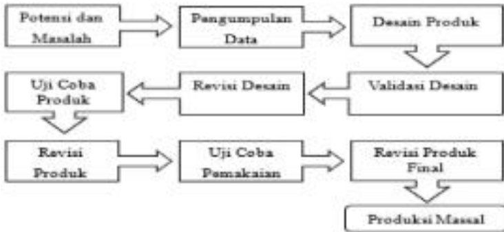
Gambar 1. Langkah-langkah pengembangan Borg and Gall

penelitian langkah-langkah pengembangan Borg and Gall .