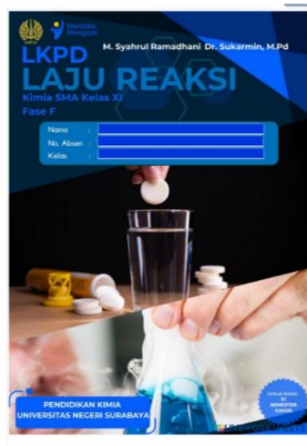
Gambar 2. Cover E-LKPD

Tahap desain produk merupakan tahapan untuk merancang E-LKPD menerapkan strategi conceptual change yang dapat mereduksi miskonsepsi peserta didik. Pertama yaitu mendesain draft E-LKPD secara kasar pada microsoft office word yang kemudian disempurnakan dengan hiasan layout dan cover yang mendukung. Setelah draft E-LKPD sudah siap maka langkah selanjutnya adalah mengupload draft E-LKPD ke dalam web liveworksheets untuk memberikan kesan yang menarik, serta memberikan ketertarikan terhadap peserta didik dalam mengolah web liveworksheets tersebut. Berikut draft E-LKPD yang telah diupload ke dalam web liveworksheets .