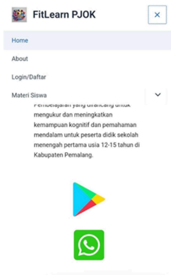
Gambar 2. Tampilan Navigasi

Antarmuka dirancang sederhana dan mudah dipahami, dengan memperhatikan pemilihan warna, ukuran huruf, ikon, dan penempatan tombol agar sesuai dengan karakteristik siswa SMP. Selain itu, aspek multimedia seperti penggunaan gambar, animasi, video, dan kuis interaktif juga dipertimbangkan untuk meningkatkan keterlibatan siswa dalam proses belajar.