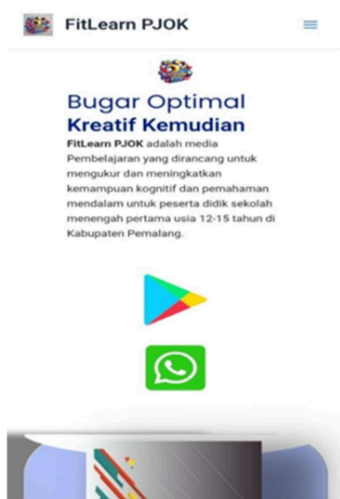
Gambar 1. Tampilan Antar Muka

Pada tahap desain, peneliti menyusun rancangan awal aplikasi FitLearn PJOK berbasis Android berdasarkan hasil analisis kebutuhan sebelumnya. Desain ini meliputi struktur konten, alur navigasi, tampilan antarmuka, serta penyusunan instrumen evaluasi yang akan digunakan. Setiap materi disusun secara sistematis mengikuti capaian pembelajaran PJOK, mulai dari pengenalan gerak dasar, penjelasan langkah-langkah, hingga pemberian latihan.