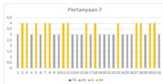
Grafik 7. Pertanyaan 7

Diagram batang ini menunjukkan bahwa responden memilih tidak setuju dengan jumlah 0, kurang setuju 2, setuju 19, dan sangat setuju 11. Maka dapat disimpulkan bahwa banyak orang tua yang berencana untuk menerapkan aturan penggunaan gadget dirumah.