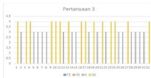
Grafik 3. Pertanyaan 3

Diagram batang ini menunjukkan bahwa responden memilih tidak setuju dengan jumlah 0, kurang setuju 0, setuju 12, dan sangat setuju 20. Maka dapat disimpulkan bahwa banyak orang tua yang menyadari pentingnya membatasi waktu penggunaan gadget pada anak.