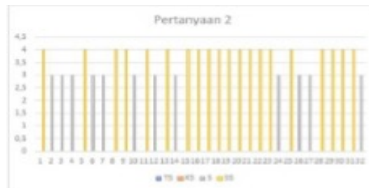
Grafik 2. Pertanyaan 2

Diagram batang ini menunjukkan bahwa responden memilih tidak setuju dengan jumlah 0, kurang setuju 0, setuju 17, dan sangat setuju 15. Maka dapat disimpulkan bahwa banyak orang tua yang memahami pentingnya pengaruh gadget untuk perkembangan anak.