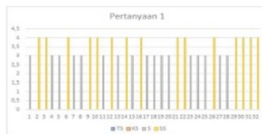
Grafik 1. Pertanyaan 1

Berdasarkan hasil instrumen maka didapatkan hasil dari setiap pertanyaan sebagai berikut;