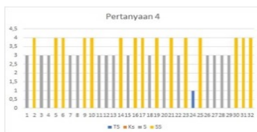
Grafik 4. Pertanyaan 4

Diagram batang ini menunjukkan bahwa responden memilih tidak setuju dengan jumlah 0, kurang setuju 0, setuju 17, dan sangat setuju 15. Maka dapat disimpulkan bahwa banyak orang tua yang memahami dampak positif dan negatif terhadap penggunaan gadget bagi anak.