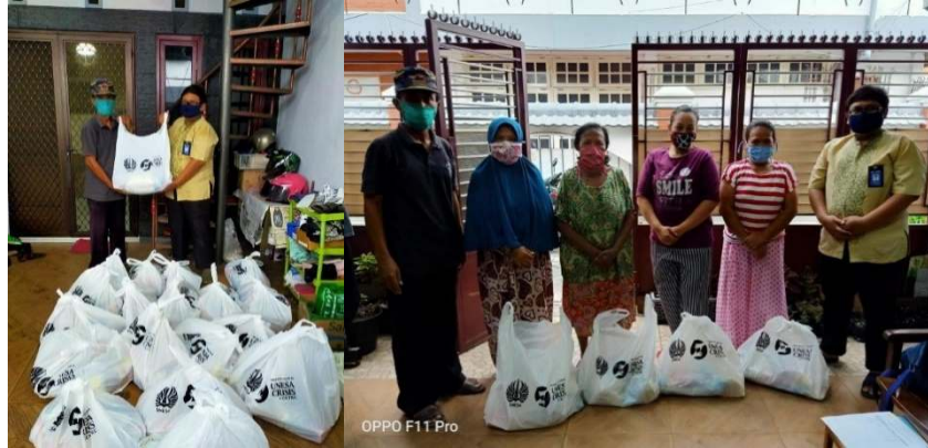
Gambar 5. Penyerahan Bantuan Paket Sembako kepada warga RT 01 / RW 10 Ngagel Rejo

Distribusi bantuan paket sembako tersebut diberikan kepada ketua RT 01 / RW 10 Kelurahan Ngagel Rejo untuk selanjutnya dibagikan kepada warga sekitar yang terdampak Covid – 19.