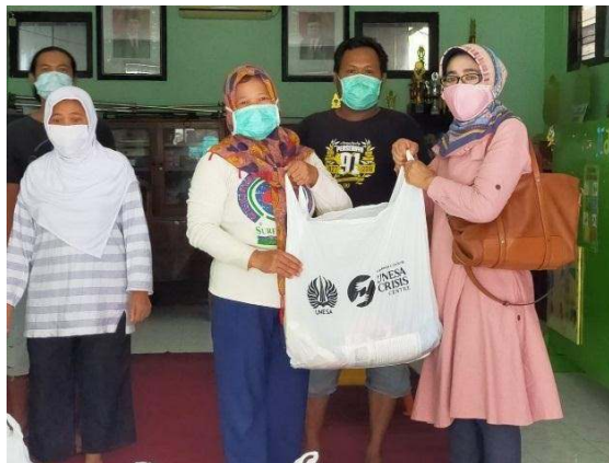
Gambar 3. Penyerahan Bantuan Paket Sembako kepada warga RW. 5 Karah

Melalui UCC (Unesa Crisis Center) bantuan akan diberikan ke civitas akademika yang terdampak dan beberapa masyarakat terdampak yang telah ditentukan oleh UCC. Untuk pembagian bantuan paket sembako di wilayah karah dilaksanakan di dua tempat yaitu warga RW 5 sebanyak 50 paket, dan panti asuhan AL – HASAN Karah sebanyak 25 paket. Gambar 2: Penyerahan Bantuan Paket Sembako kepada warga RW. 5 Karah.