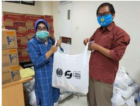
Gambar 2. Penyerahan Bantuan Paket Sembako kepada Panitia UCC

Melalui UCC (Unesa Crisis Center) bantuan akan diberikan ke civitas akademika yang terdampak dan beberapa masyarakat terdampak yang telah ditentukan oleh UCC. Untuk pembagian bantuan paket sembako di wilayah karah dilaksanakan di dua tempat yaitu warga RW 5 sebanyak 50 paket, dan panti asuhan AL – HASAN Karah sebanyak 25 paket. Gambar 2: Penyerahan Bantuan Paket Sembako kepada warga RW. 5 Karah.