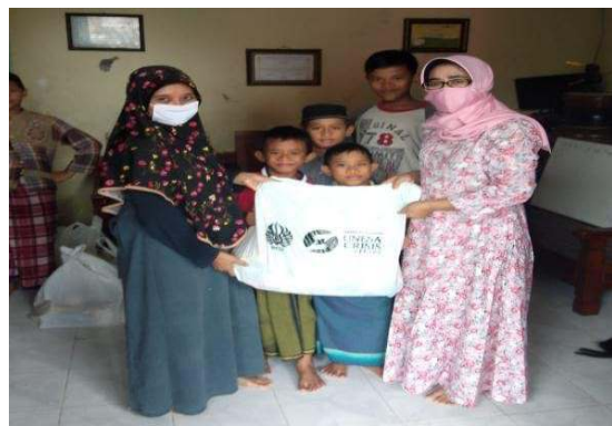
Gambar 4. Penyerahan Bantuan Paket Sembako kepada Panti Asuhan AL – HASAN Karah

Lokasi pembagian bantuan paket sembako selanjutnya adalah di wilayah Kelurahan Ngagel Rejo, dimana jumlah paket bantuan sembako yang diberikan sebanyak 25 paket.