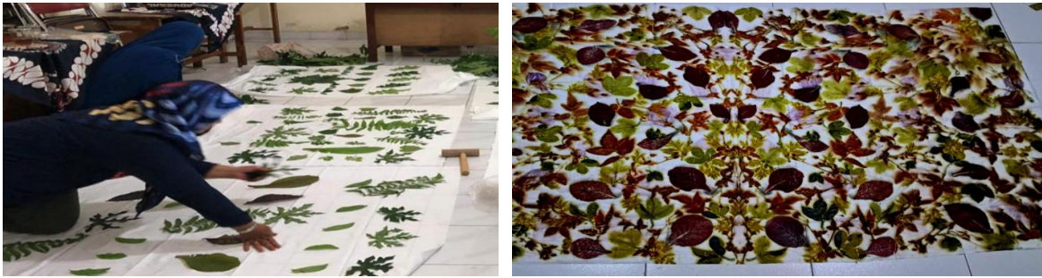
Gambar 3. Demonstrasi dan Hands-on Practice Peserta Pelatihan Batik Ecoprint

Produk yang dihasilkan memiliki keunggulan pada motif alami khas Magetan serta ramah lingkungan. Warna daun jati menghasilkan corak coklat kemerahan, sedangkan daun lanang memberi nuansa hijau muda. Namun, kelemahan utama terletak pada ketahanan warna terhadap pencucian berulang, sehingga perlu pelatihan lanjutan tentang fixation process yang lebih optimal. Kegiatan ini menjadi bentuk nyata difusi ipteks dari perguruan tinggi kepada masyarakat, sebagaimana dikemukakan oleh Saptutyingsih dan Wardani (2019) bahwa transfer teknologi sederhana berbasis kearifan lokal dapat meningkatkan nilai tambah ekonomi rumah tangga tanpa menimbulkan dampak negatif terhadap lingkungan.