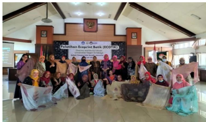
Gambar 4. Proses Pendampingan Berkelanjutan

Setelah pelatihan, tim melakukan pendampingan untuk memastikan keterampilan dapat diterapkan secara berkelanjutan. Pendampingan meliputi pembuatan desain baru, penentuan harga jual, pengemasan produk, dan strategi pemasaran digital menggunakan Instagram dan WhatsApp Business.