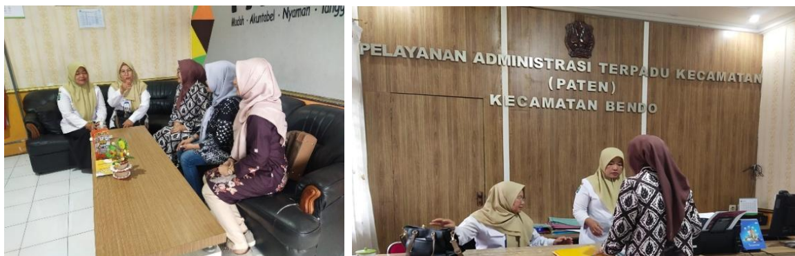
Gambar 2. Koordinasi dengan Perangkat Pemerintahan Kecamatan Bendo

Selain itu, tim melakukan koordinasi dengan pemerintah desa dan pengurus PKK untuk menentukan lokasi pelatihan dan memastikan ketersediaan peserta. Persiapan yang matang ini menjadi faktor penting keberhasilan kegiatan, hal ini menegaskan bahwa analisis kebutuhan dan sinergi dengan komunitas lokal merupakan prasyarat keberhasilan program pemberdayaan Masyarakat (Darwis et al., 2020).