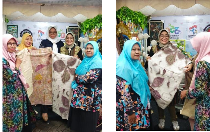
Gambar 5. Keberlanjutan Program Mengikuti Pameran Produk Lokal di Alun-Alun Kabupaten Magetan

Evaluasi dilakukan menggunakan kuesioner kepuasan peserta dan observasi hasil. Sebanyak 96% peserta menyatakan puas terhadap kegiatan, dan 92% mengaku keterampilannya meningkat signifikan. Tingkat ketercapaian target kegiatan secara keseluruhan mencapai 94%, yang meliputi peningkatan pengetahuan, keterampilan teknis, dan kemandirian berwirausaha.