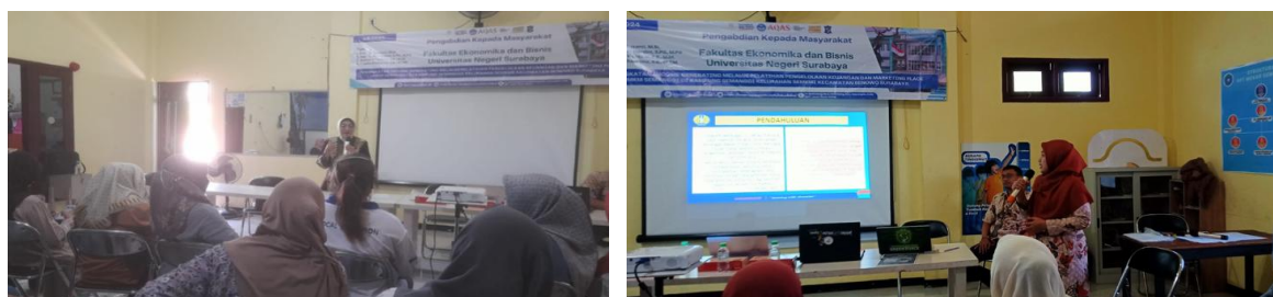
Gambar 3. Proses Pendampingan Berkelanjutan

Tahap ini dilakukan dalam bentuk penyuluhan dan sosialisasi dengan tema “Pemanfaatan Sumber Daya Alam Lokal untuk Produk Kreatif Ramah Lingkungan”. Materi penyuluhan meliputi pengenalan konsep eco-fashion , manfaat batik ecoprint, dan potensi ekonominya.