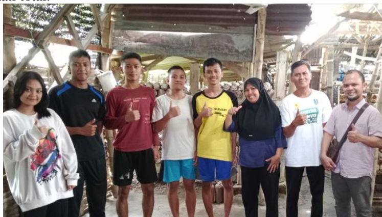
Gambar 2. Pertemuan untuk membahas identifikasi permasalahan, diagnosa teknis dan rekomendasi solusi

Pada Gambar 1 (c) tampak bahwa rak baglog jamur juga mengalami pelapukan. Risiko rak baglog jamur bila tidak diganti maka akan menimbulkan beberapa permasalahan antara lain: (1) Risiko keselamatan kerja. Rak dapat runtuh secara tiba-tiba. Ini adalah risiko paling berbahaya. Rak yang rusak (kayu keropos, baut longgar, struktur bengkok) memiliki daya dukung yang sangat berkurang. Dampaknya adalah rak yang runtuh dapat menimpa petani yang sedang bekerja, menyebabkan cedera serius, patah tulang, atau bahkan kematian. Ribuan baglog yang jatuh juga dapat melukai pekerja.; (2) Risiko Kerusakan Langsung pada Produk (Baglog & Jamur). Hal ini dapat menyebabkan kerusakan fisik pada baglog. Dampaknya adalah baglog yang jatuh dari ketinggian akan mengalami kerusakan fisik. Plastik pembungkus bisa sobek, media tanam menjadi pecah dan tidak padat lagi. Konsekuensinya adalah baglog yang rusak fisiknya sangat rentan terhadap kontaminasi oleh jamur kompetitor atau bakteri karena ada celah bagi patogen untuk masuk.; (3) Risiko gagal panen dan penurunan kualitas jamur. Dampaknya adalah jatuhnya baglog mengganggu proses pertumbuhan miselium yang sedang berjalan. Baglog yang sudah memiliki calon jamur ( pinhead ) bisa stres dan gagal berkembang. Konsekuensinya adalah produktivitas anjlok secara instan karena baglog yang rusak tidak akan menghasilkan jamur yang optimal, bahkan bisa mati total.