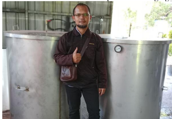
Gambar 4. Ketua PKM berada di depan steamer berkapasitas 2x 250 baglog untuk kelompok petani jamur Desa Punggul Kecamatan Gedangan Kabupaten Sidoarjo