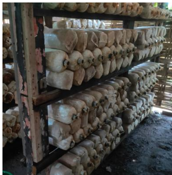
Gambar 8. Kondisi rak baglog jamur yang sudah diperbaiki dan siap pakai