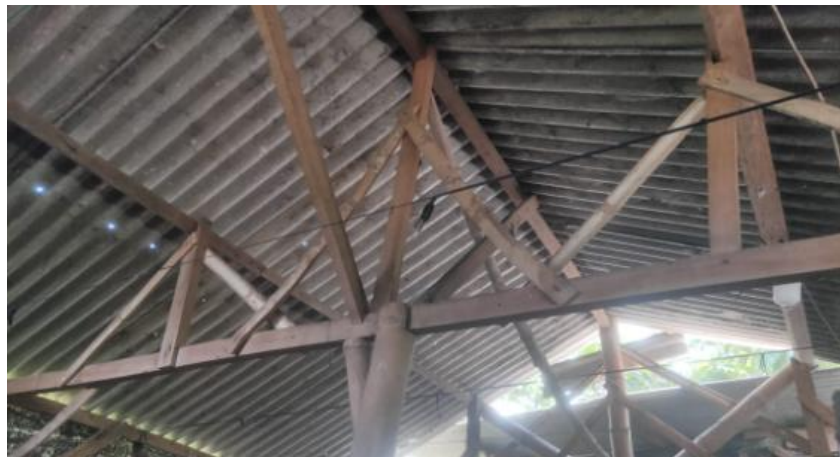
Gambar 7. Kuda-kuda atap telah diperbaiki dari yang semula lapuk (Gbr. 1b)