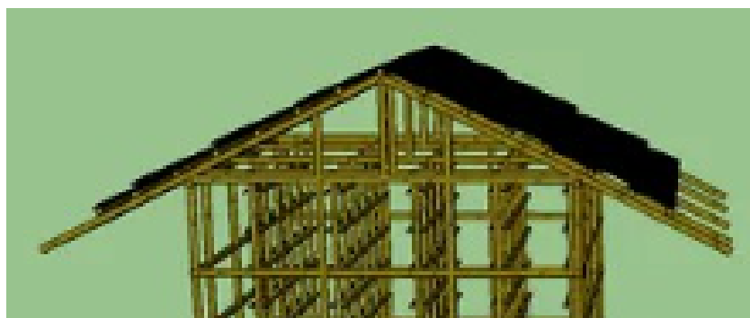
Gambar 5. Rencana atap kumbang jamur

Untuk penggantian rangka atap dan rak baglog jamur diperlukan antar lain: gedeg 1,5 x 3 meter sebanyak 7 pcs untuk mengganti yang telah rusak, bangkotan bambu diperlukan sebanyak 24 pcs, kayu dengan ukuran 6x10x4 cm sebanyak 8 pcs, kayu 4x6x4 sebanyak 1 pcs, paku 2” sebanyak 1kg, paku 3” sebanyak 1kg, paku payung sebanyak 1kg, gergaji sanflex 2 kg, dan kawat sebanyak 3 ikat. Berikut rencana atap kumbang jamur dan rag baglog jamur.