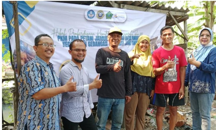
Gambar 9. Monitoring dan evaluasi pada petani jamur di Desa Punggul Kec. Gedangan Kab. Sidoarjo