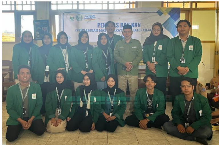
Gambar 4. Kepala Sekolah SMK AI-Islah Surabaya memberikan ucapan penutup dan apresiasi atas terlaksananya kegiatan.

Secara keseluruhan, pelaksanaan program ini menunjukkan bahwa pendekatan pelatihan berbasis praktik dan pendampingan intensif mampu meningkatkan kapasitas siswa SMK AI-Islah dalam memadukan keterampilan desain komunikasi visual dengan strategi digital marketing secara aplikatif. Hasil yang dicapai tidak hanya mencakup peningkatan pemahaman teoritis, tetapi juga keterampilan praktis yang relevan dengan kebutuhan industri kreatif saat ini. Antusiasme dan keterlibatan aktif siswa selama proses pelatihan serta keberlanjutan diskusi melalui forum daring menjadi indikator keberhasilan program ini dalam membangun kompetensi digital sekaligus menumbuhkan semangat wirausaha di kalangan pelajar vokasi.