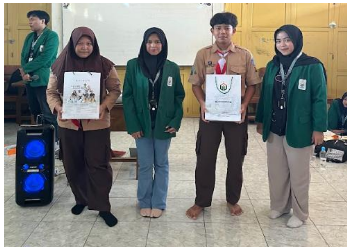
Gambar 3. Pemberian souvenir bagi peserta dengan nilai terbaik