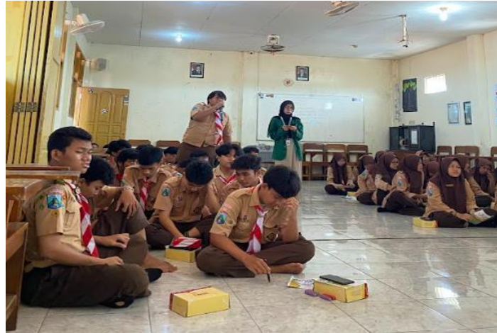
Gambar 2. Peserta menunjukkan antusiasme tinggi selama penyampaian materi

mereka. Selama masa pendampingan pasca-pelatihan yang dilakukan secara daring selama dua minggu, siswa aktif mendiskusikan tantangan dan membagikan hasil revisi konten. Mereka juga saling memberi masukan terhadap kampanye digital masing-masing. Pendampingan ini memperkuat pemahaman aplikatif sekaligus menciptakan ekosistem kolaboratif yang mendorong inovasi konten promosi.