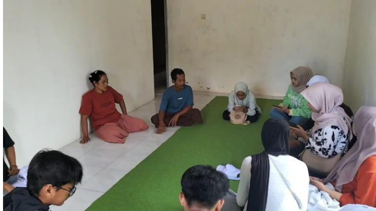
Gambar 1. Pelaksanaan Survei oleh Mahasiswa KKN Kolaboratif #3

Program Anak Tidak Sekolah (ATS) telah digelar secara aktif oleh Pemkab Jember bersama UNICEF untuk meningkatkan kesadaran akan pentingnya pendidikan dan memberikan bantuan kepada keluarga kurang mampu (Guntoro, 2024). Dalam pelaksanaan programnya, pemerintah Kabupaten Jember menggandeng mahasiswa KKN Kolaboratif#3 melalui survei di setiap desa tempat mahasiswa melaksanakan KKN. Kegiatan dilakukan dengan melakukan survei ke masing-masing anak, di mana setiap mahasiswa memiliki data anak-anak yang harus disurvei, berdasarkan data yang ada di website ATS milik Pemerintah Kabupaten Jember.