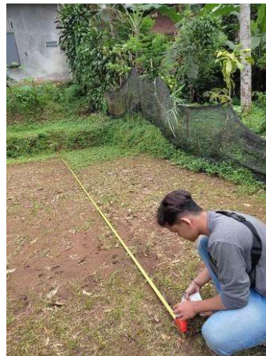
Gambar 12 Pengukuran Lapangan Bola Voli