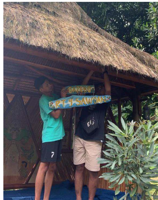
Gambar 10 Pemasangan Plat Kepala Desa, Kasun, RT, RW, fasilitas umum

Program ini bertujuan untuk mempermudah masyarakat dalam mengarahkan dan mengetahui tata letak rumah warga dan juga mempermudah pengunjung dalam mencari rumah warga, serta membantu UMKM Desa Pait dalam pendataan lokasi produksi agar orang lebih mengenal lebih cepat. Desa Pait lebih tertata karena setiap rumah memiliki nomor dan mengetahui berapa jumlah rumah di Desa Pait. Adapun hasil kegiatan akan diuraikan sebagai berikut :