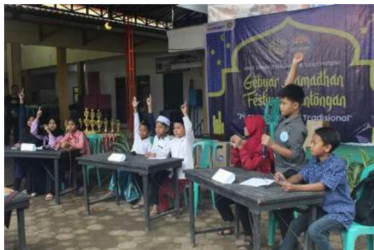
Gambar 22 Lomba Cerdas Cermat