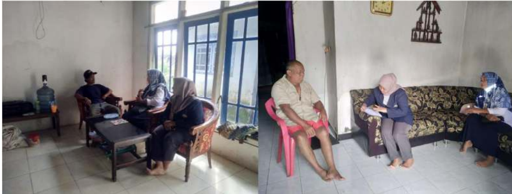
Gambar 17 Penyuluhan Program Jamban Sehat