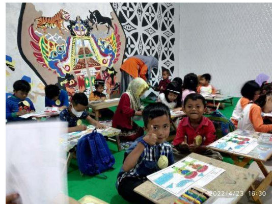
Gambar 21 Lomba Mewarnai