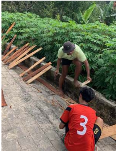
Gambar 2 Pemotongan kayu