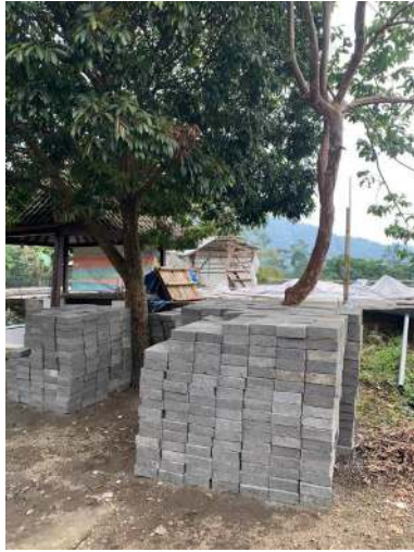
Gambar 13 Paving