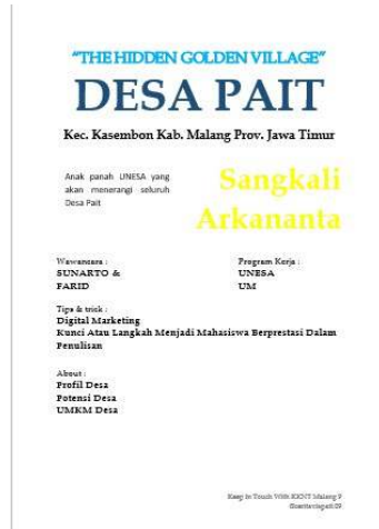
Gambar 26 Before editing Majalah