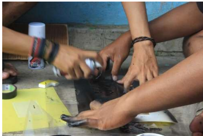
Gambar 4 Waktu penyemprotan kayu dengan pylox sesuai cetakan