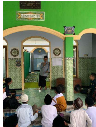
Gambar 20 Lomba Adzan