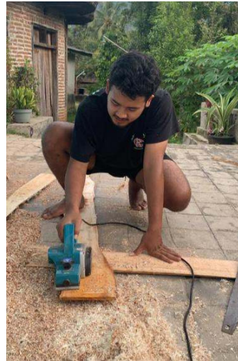
Gambar 3 Proses penghalusan kayu