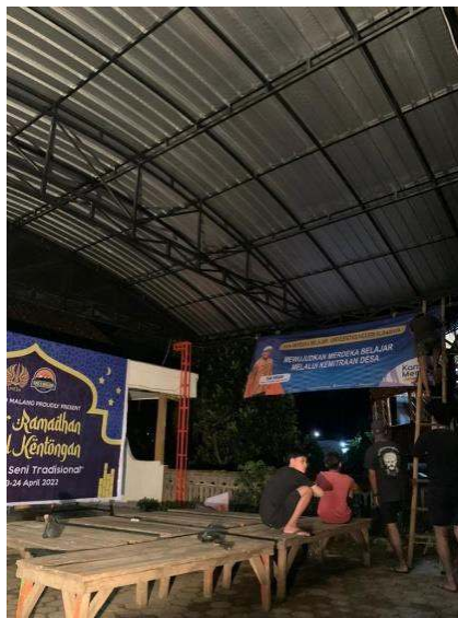
Gambar 19 Pemasangan panggung