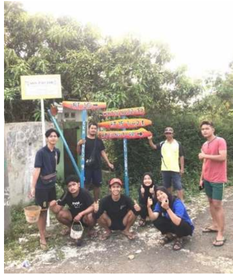
Gambar 9 Pemasangan petunjuk jalan keterangan RT