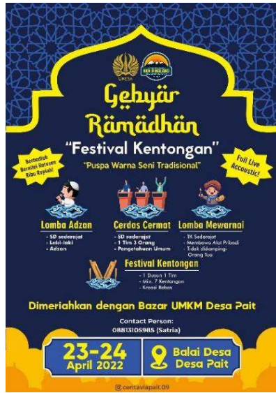
Gambar 18 Penyebaran pamflet