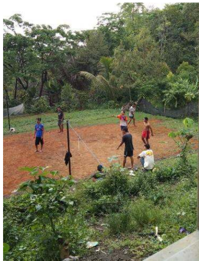
Gambar 11 Lapangan Bola Voli