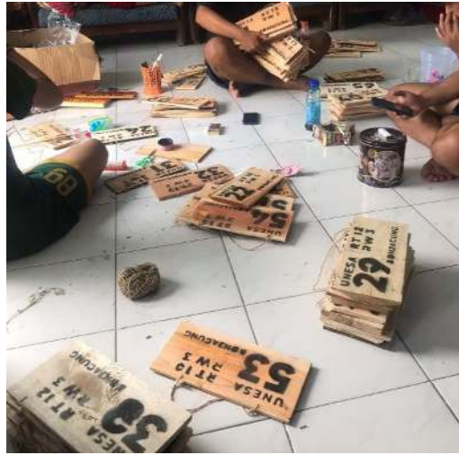
Gambar 6 Nomor rumah di plong lalu di tali