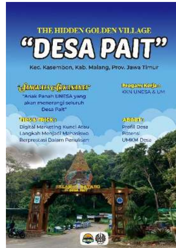
Gambar 27 After editing Majalah