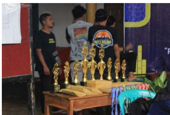
Gambar 24 Piala dan Hadiah