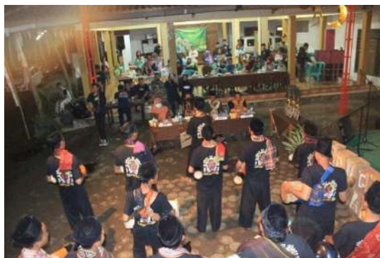
Gambar 23 Lomba Kentongan