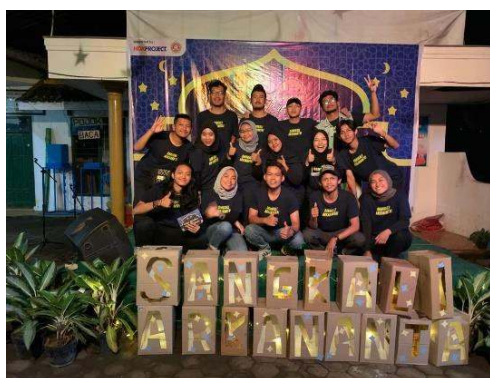
Gambar 25 Pelaksana Gebyar Ramadhan