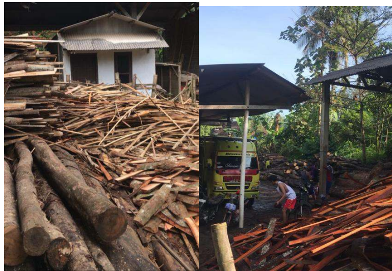
Gambar 1 Ambil dan pilah kayu sisa.

Program kerja pembuatan nomer rumah dan petunjuk jalan merupakan bentuk kegiatan positif yang memberi manfaat untuk banyak pihak bagi seluruh warga Desa Pait. Untuk pembuatan dari nomer rumah dan petunjuk jalan terbuat dari kayu sisa warga yang memiliki tempat pengolahan kayu sisa. Kemudian kayu tersebut dipotong menjadi bentuk persegi panjang ukuran 15 x 30 cm, lalu di haluskan dengan alat penghalus (ketam). Setelah itu, sebelum kayu akan di pylox atau cat semprot kalengan, KKN Malang 9 membuat desain bertuliskan Unesa, nama dusumn, RT dan RW lalu di print untuk membuat cetakan dari map. Berikut langkah pembuatan nomer rumah dan petunjuk jalan sebagai berikut :