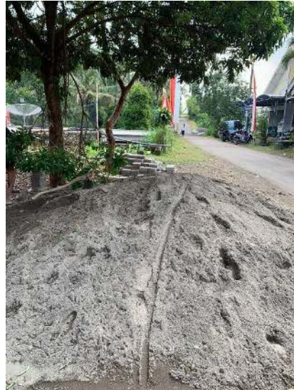
Gambar 14 Pasir

Dari kegiatan revitalisasi lapangan ini nantinya, bertujuan untuk memperindah lapangan agar warga desa semakin giat berlatih. Selain itu, diharapkan aktivitas olahraga desa pait menjadi lebih tinggi lagi. Ini menjadi salah satu langkah menumbuhkan rasa suka terhadap kegiatan olahraga. Karena olahraga adalah salah satu faktor terpenting dalam keseharian agar kita sehat dan juga mengisi waktu luang yang kosong. Mengingat sejarah desa pait pernah menjuarai kompetisi bola voly se malang raya, kami semakin bersemangat untuk berpartisipasi dalam pembangunan untuk kemajuan bola voli di desa ini. Melanjutkan prestasi dan mengukir sejarah baru adalah harapan besar kami untuk olahraga didesa ini.