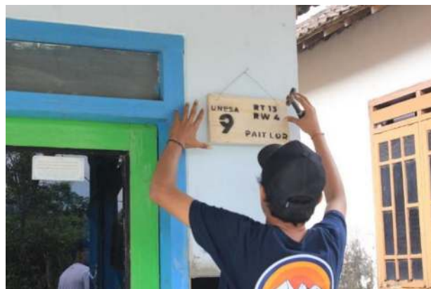
Gambar 8 Pemasangan nomor rumah