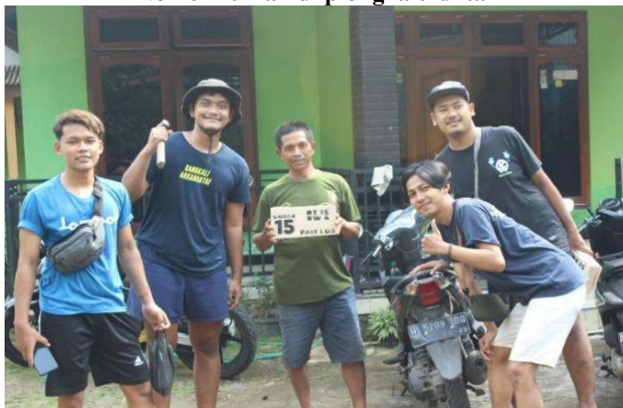
Gambar 7 Pembagian nomor rumah