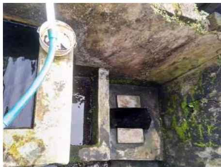
Gambar 15 Kondisi Kamar Mandi

Dari hasil koordinasi, akhirnya dari pihak desa Pait menerima pengajuan tersebut dan akan memberikan bantuan jamban sehat sebanyak 12 jamban. Penyuluhan PHBS dilakukan dengan memberikan informasi kepada masyarakat di Dsn. Slatri Ds. Pait khususnya warga RT 4 mengenai Perilaku Hidup Bersih dan Sehat tentang Penyuluhan dan Pemberian bantuan mengenai jamban sehat.