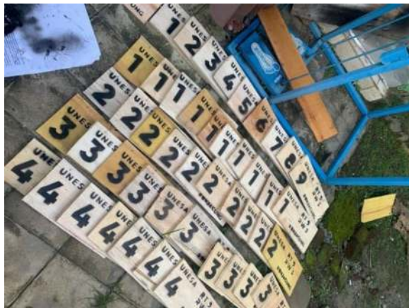
Gambar 5 Hasil dari kayu di Pylox sesuai cetakan