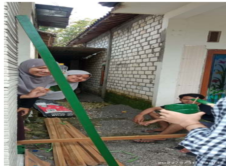
Gambar 3. Pengecatan plang

Gambar 2 merupakan proses mendesain plang dimana mahasiswa KKN melakukan pendesainan dengan cara desain di print dengan kertas setelah itu kertas digunting sehingga bisa membentuk huruf - huruf yang menjadi tulisan plang.