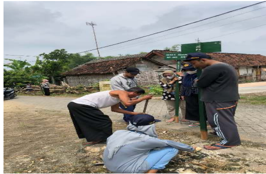
Gambar 5 : Proses penggalian tanah

Gambar 5 merupakan proses penggalian tanah yang digunakan untuk menancapkan plang. Penggalian tanah dilakukan dengan kedalaman kira - kira 50cm.