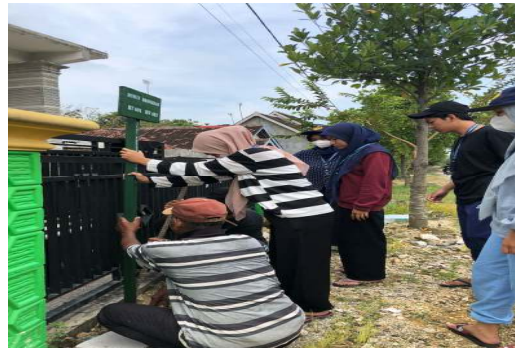
Gambar 6. Proses penancapan

Gambar 5 merupakan proses penggalian tanah yang digunakan untuk menancapkan plang. Penggalian tanah dilakukan dengan kedalaman kira - kira 50cm.