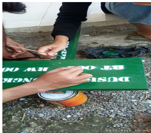
Gambar 4 : Proses Penancapan paku

Gambar 3 merupakan proses pengecatan plang yang mana warna yang dipilih adalah warna hijau yang menandakan ketenangan dan warna hijau dipilih karna warna hijau merupakan warna yang jelas dipandang sedangkan untuk warna pada desain tulisan adalah warna putih. Setelah papan plang dicat semua bagian setelah itu bagian tulisan dipilok.