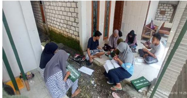
Gambar 2 : Proses Desain plang

Gambar 2 merupakan proses mendesain plang dimana mahasiswa KKN melakukan pendesainan dengan cara desain di print dengan kertas setelah itu kertas digunting sehingga bisa membentuk huruf - huruf yang menjadi tulisan plang.