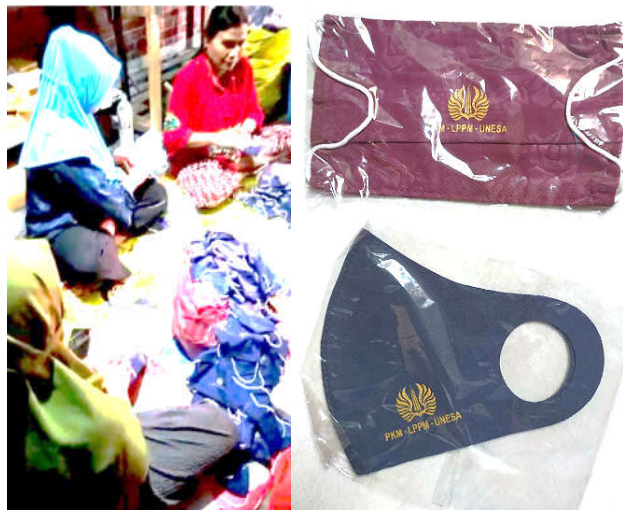
Gambar 3. Hasil Akhir Pembuatan Masker setelah Edukasi Pendampingan dan Packaging Siap Didistribusikan