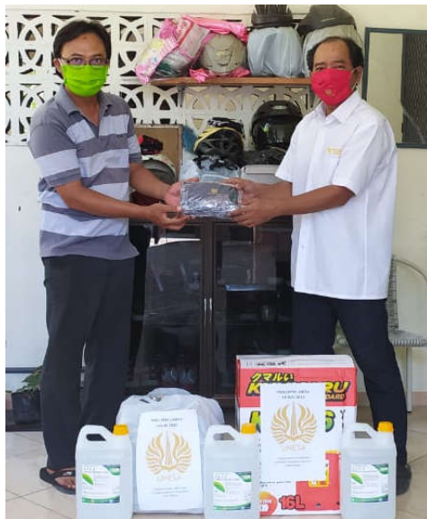
Gambar 4 Penerima Manfaat Hasil PKM Unesa