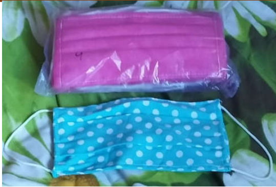
Gambar 1. Pembuatan Masker sebelum Edukasi dan Pendampingan