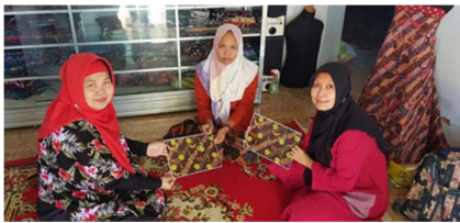
Gambar 5 Tim PKM dan Pengrajin

Desain yang telah siap selanjutnya dikenakan pada mitra pengrajin batik (Gambar 5). Tim PKM mendampingi mitra membuat kain batik. Mitra diberikan contoh motif dan berdiskusi dengan tim PKM. Komentar dari pengrajin yaitu motif yang dibuat agak lebih rumit tidak seperti yang mereka kerjakan.