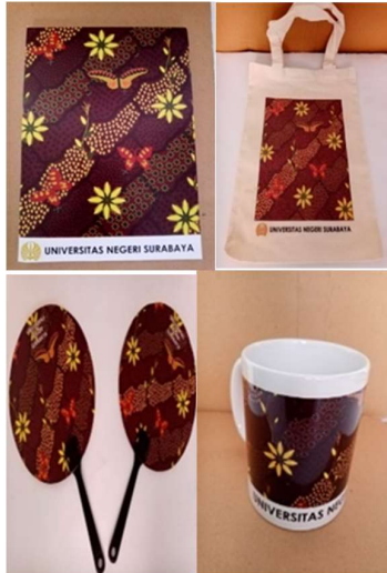
Gambar 7. Diversifikasi produk

biasanya mengandung aroma khas yang muncul ketika menyatu dengan serat kapas; 4. kain batik yang menggunakan pewarna alami memiliki nilai yang lebih tinggi dibandingkan dengan pewarna kimia (Anshari dan Adi Kusrianto, 2011).