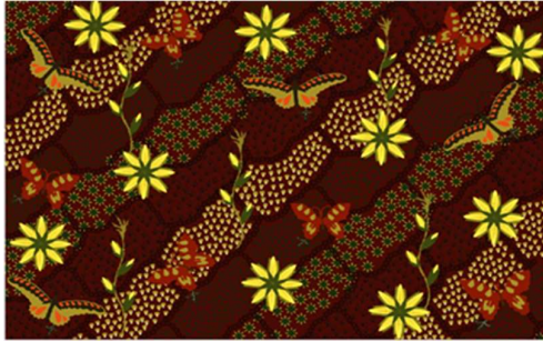
Gambar 4. Desain Batik Unggulan

Desain yang telah siap selanjutnya dikenakan pada mitra pengrajin batik (Gambar 5). Tim PKM mendampingi mitra membuat kain batik. Mitra diberikan contoh motif dan berdiskusi dengan tim PKM. Komentar dari pengrajin yaitu motif yang dibuat agak lebih rumit tidak seperti yang mereka kerjakan.