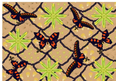
Gambar 3. Desain batik kedua

Desain pertama direvisi dan kemudian menghasilkan desain kedua (Gambar 3). Desain kedua telah menunjukkan posisi kupu-kupu dan jagung di tengah yang diikat dengan rantai. Akan tetapi, desain ini masih menunjukkan kekurangan yaitu warna dan isian dari setiap kotak belum ada, sehingga desain ini masih perlu direvisi ulang.