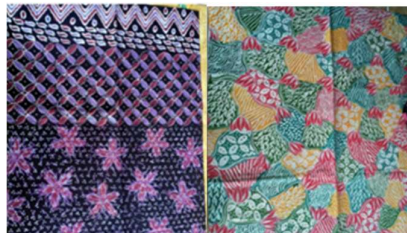
Gambar 1. Corak Batik Kontemporer Pamekasan

Kondisi tersebut sangat berdampak pada pengusaha/pengrajin batik di kabupaten Pamekasan. Pengrajin batik Pamekasan menerima pesanan dan atau dipasarkan di Bangkalan, sulit bagi pengusaha/pengrajin batik memasarkan produk batik di daerah Pamekasan dan Surabaya. Berdasarkan wawancara dengan beberapa orang pengrajin/pengusaha batik di Pamekasan, Pamekasan belum memiliki corak berciri khas Pamekasan atau masih berkiblat dengan corak batik Bangkalan. Mereka sering mencampuraduk corak batik Jawa dan Bangkalan, corak ini disebut corak kontemporer (Gambar 1). Gambar 1 memperlihatkan corak kawung yang merupakan corak Solo dan Yogyakarta dan corak bunga Pekalongan, sedangkan warna batik yang berani merupakan ciri khas Madura pada umumnya seperti merah dan hijau.