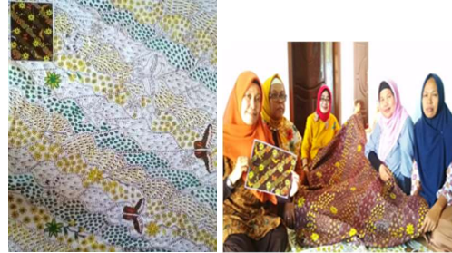
Gambar 6. Hasil desain yang belum diwarnai dan yang sudah diwarnai

Setelah sebulan pengerjaan hasil dari pengrajin tidak sesuai harapan. Hal ini disebabkan alat bati tulis canting yang digunakan terlalu besar. Akan tetapi pengrajin berjanji untuk memperbaiki sesuai desain (Gambar 6).