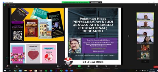
Gambar 1. Tangkap Layar Penyampaian Materi oleh Narasumber

Setelah sesi pembukaan, kegiatan dilanjutkan pada pemaparan materi tentang Pelatihan Riset Penyelesaian Studi S-1 dengan Art Based Research (Educational Research) oleh Prof. Dr. Sumiyadi, M.Hum. Materi disampaikan dengan menggunakan media PPT dan dengan metode penyampaian yang cukup interaktif. Kegiatan ini diikuti oleh 44 peserta yang hadir melalui Zoom Meeting .