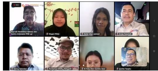
Gambar 5. Tangkap Layar Kegiatan Pengecekan Kemajuan Penyusunan Proposal ABR

Pada kegiatan yang secara daring, dilakukan pengecekan progress penyusunan proposal riset penciptaan karya sastra dengan metode ABR. Sebelum dilakukan pertemuan ini, peserta telah mengumpulkan proposal risetnya, meski masih sebagai draf awal. Kegiatan ini dilakukan dengan memberikan penguatan materi kembali dan pengecekan proposal dari beberapa mahasiswa.