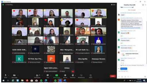
Gambar 3. Foto Bersama secara Virtual di Akhir Pertemuan