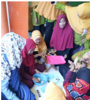
Gambar 3. Kegiatan Pelatihan Pembuatan Kue Kering

Setiap peserta dibebaskan untuk memilih produk mana yang ingin ia buat dan ia pelajari. Pembuatan produk diawasi dan dibimbing oleh instruktur. Pembuatan pia kelor dibimbing oleh bu Nugrahani, pembuatan pastel kering isi abon di bimbing oleh bu Mauren, pembuatan kue kacang kelor dibimbing oleh bu Sri Handajani, dan pembuatan soes kering abon ikan dibimbing oleh bu Nugrahi dan bu Mauren.