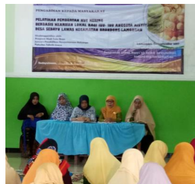
Gambar 2. Kegiatan Pembukaan dan Pemberian Materi Pelatihan

Tim PKM disambut oleh Kepala Sekolah TK Aisyiyah Bustanul Athfal yang merangkap