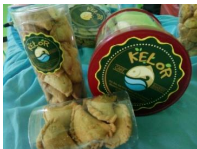
Gambar 4. Contoh Produk Pelatihan (kue kacang kelor, pastel kering tuna, sus kering tuna)

Program pengabdian kepada masyarakat berupa pelatihan pembuatan kue kering