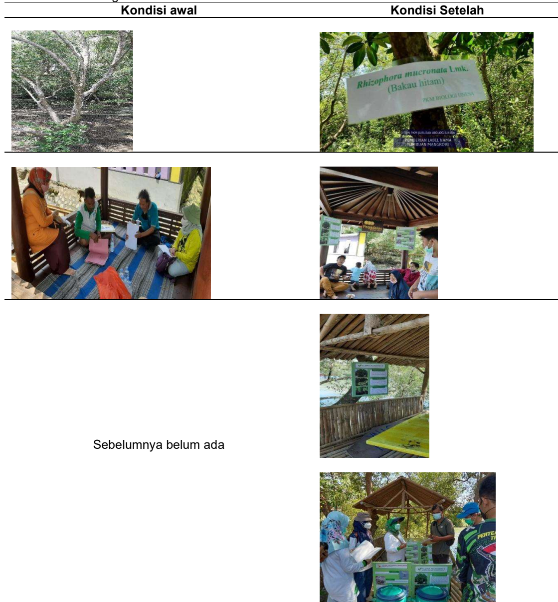
Tabel 4. Perbandingan Kondisi Sebelum PKM dan Setelah PKM

Secara umum perbandingan Ekowisata pada kondisi awan dan setelah PKM seperti pada gambar dalam tabel berikut ini :