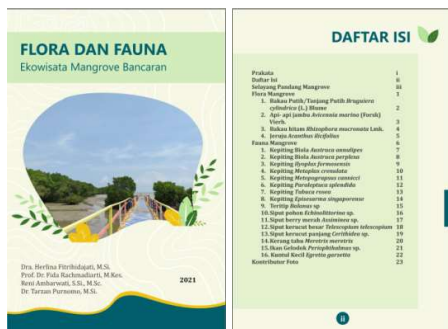
Gambar 4. Booklet Flora dan Fauna Mangrove Bancaran dalam Bentuk Hardcopy maupun E-Book

Selanjutnya tahap Pelaksanaan Kegiatan PKM yang dilakukan pada hari Minggu, 19 September 2021 di Ekowisata Mangrove Bancaran, Bangkalan. Pada dasarnya kegiatan pelaksanaan merupakan tindak lanjut dari hasil diskusi yang intensif saat survey awal yaitu berupa rencana untuk pengembangan ekowisata. Sesuai keinginan pengelola atau pokdarwis tim PKM menindaklanjuti dengan penyerahan hasil pendampingan terhadap beberapa hal seperti draf usulan rencana pengembangan, pembuatan booklet dan poster tentang kekayaan flora dan fauna mangrove Bancaran sebagai hasil identifikasi dari tim PKM, labelling pohon di mangrove dan pemberian bantuan tempat sampah untuk menjaga kebersihan. Kegiatan pelaksanaan tersebut seperti terlihat pada gambar berikut: