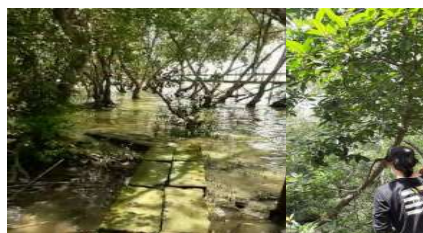
Gambar 2. Identifikasi Sampel Tumbuhan Mangrove Bancaran

Kegiatan berikutnya dilanjutkan dengan penyusunan draf model pengembangan ekowisata melalui hasil identifikasi mangrove dan sarana prasarannya oleh Tim PKM sampai dihasilkan hasil identifikasi berupa booklet, poster, label nama tumbuhan, tempat sampah dan program rencana pengembangan Ekowisata.