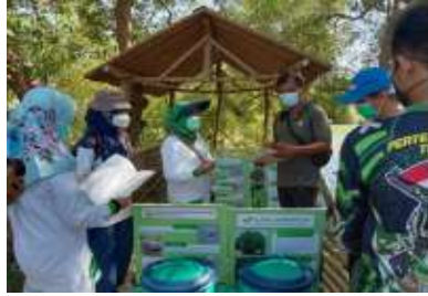
Gambar 3. Penyerahan booklet kekayaan flora dan fauna mangrove bancaran

serta pemberian bantuan berupa tempat sampah