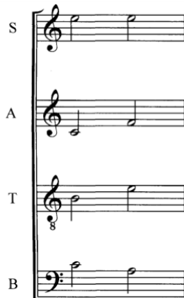
Gambar 1 Extended notes in the middle of a voicing create a jazzy effect. (by: Miller,2007)