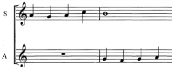
Gambar 4. A call-and-response harmony line (by: Miller,2007)