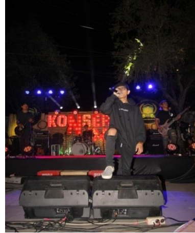
Gambar 2 Grup band Friend Over You pada acara konser amal yang diadakan oleh komunitas Asosiasi Seni Anak Band Kediri.