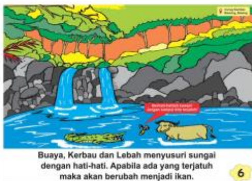
Gambar 8. Halaman Keenam Big Book Kearifan Lokal oleh Novita Lusiana (2020)

Cerita media big book di halaman keempat dan kelima yang diangkat oleh Novita Lusiana (2020) berlatar di pemandian air panas Sangu Banyu di Desa Pesangrahan, Kecamatan Bawang. Menurut Nur Khikmah (2018: 1) berendam di pemandian air hangat Sangu Banyu sampai saat ini dipercaya oleh masyarakat sekitar dapat menyembuhkan penyakit kulit.