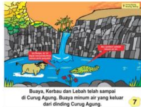
Gambar 9. Halaman Ketujuh Cerita oleh Novita Lusiana (2020)

Halaman keenam media big book tersebut berlatar di Curug Kembar. Curug Kembar terletak di Desa Candirejo, Kecamatan Bawang. Curug ini dipercaya oleh masyarakat sekitar siapapun yang jatuh ke Curug Kembar, maka akan menjadi ikan.