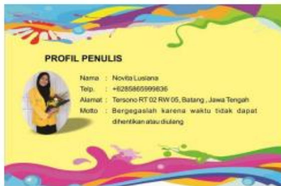
Gambar 2. Sampul Belakang Big Book Berbasis Kearifan Lokal oleh Novita Lusiana (2020)