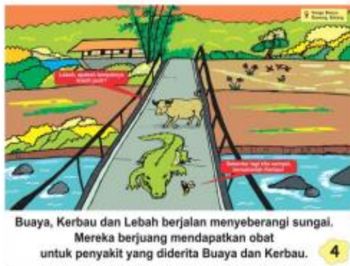
Gambar 6. Halaman Keempat Cerita oleh Novita Lusiana (2020)