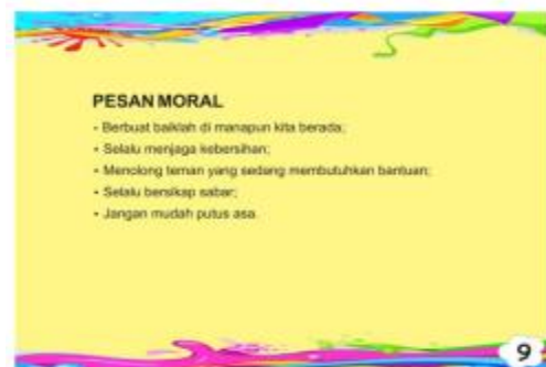
Gambar 11. Halaman Sembilan Cerita oleh Novita Lusiana (2020)

Halaman ketujuh dan kedelapan media big book ini berlatar di Curug Agung. Curug Agung terletak di Desa Candirejo, Kecamatan Bawang. Air yang mengalir dari celah dinding Curug Agung dipercaya oleh masyarakat sekitar dapat mengobati segala jenis penyakit.