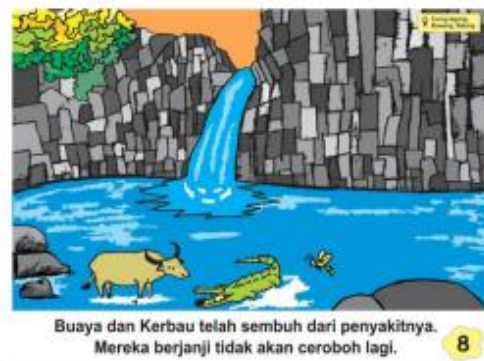
Gambar 10. Halaman Kedelapan Cerita oleh Novita Lusiana (2020)

Halaman ketujuh dan kedelapan media big book ini berlatar di Curug Agung. Curug Agung terletak di Desa Candirejo, Kecamatan Bawang. Air yang mengalir dari celah dinding Curug Agung dipercaya oleh masyarakat sekitar dapat mengobati segala jenis penyakit.