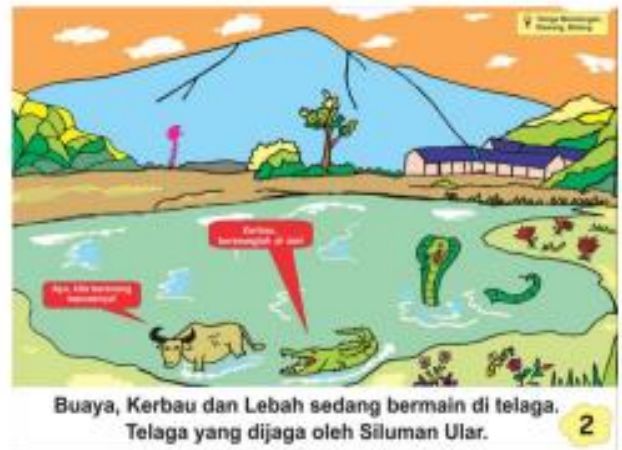
Gambar 4. Halaman Kedua Cerita oleh Novita Lusiana (2020)