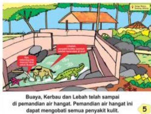
Gambar 7. Halaman Kelima Cerita oleh Novita Lusiana (2020)

Cerita media big book di halaman keempat dan kelima yang diangkat oleh Novita Lusiana (2020) berlatar di pemandian air panas Sangu Banyu di Desa Pesangrahan, Kecamatan Bawang. Menurut Nur Khikmah (2018: 1) berendam di pemandian air hangat Sangu Banyu sampai saat ini dipercaya oleh masyarakat sekitar dapat menyembuhkan penyakit kulit.