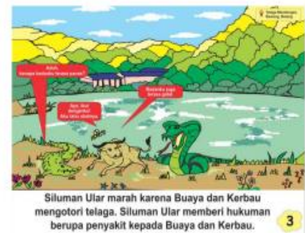
Gambar 5. Halaman Ketiga Cerita oleh Novita Lusiana (2020)

Halaman cerita pada big book tersebut berisi teks bagian cerita yang berada di bagian bawah dan dilengkapi dengan gambar ilustrasi, dialog antar tokoh, dan bagian atas dilengkapi penjelasan gambar yang memuat potensi dari daerah tempat penelitian yang diangkat oleh Novita Lusiana. Tempat tersebut berada di Kecamatan Bawang yaitu Telaga Mendongan yang terletak di Desa Pranten yang merupakan desa tertinggi di Kabupaten Batang. Telaga Mendongan menjadi kearifan lokal di Kecamatan Bawang yaitu cerita yang sampai saat ini dipercaya bahwa Telaga Mendongan dijaga oleh ular raksasa.