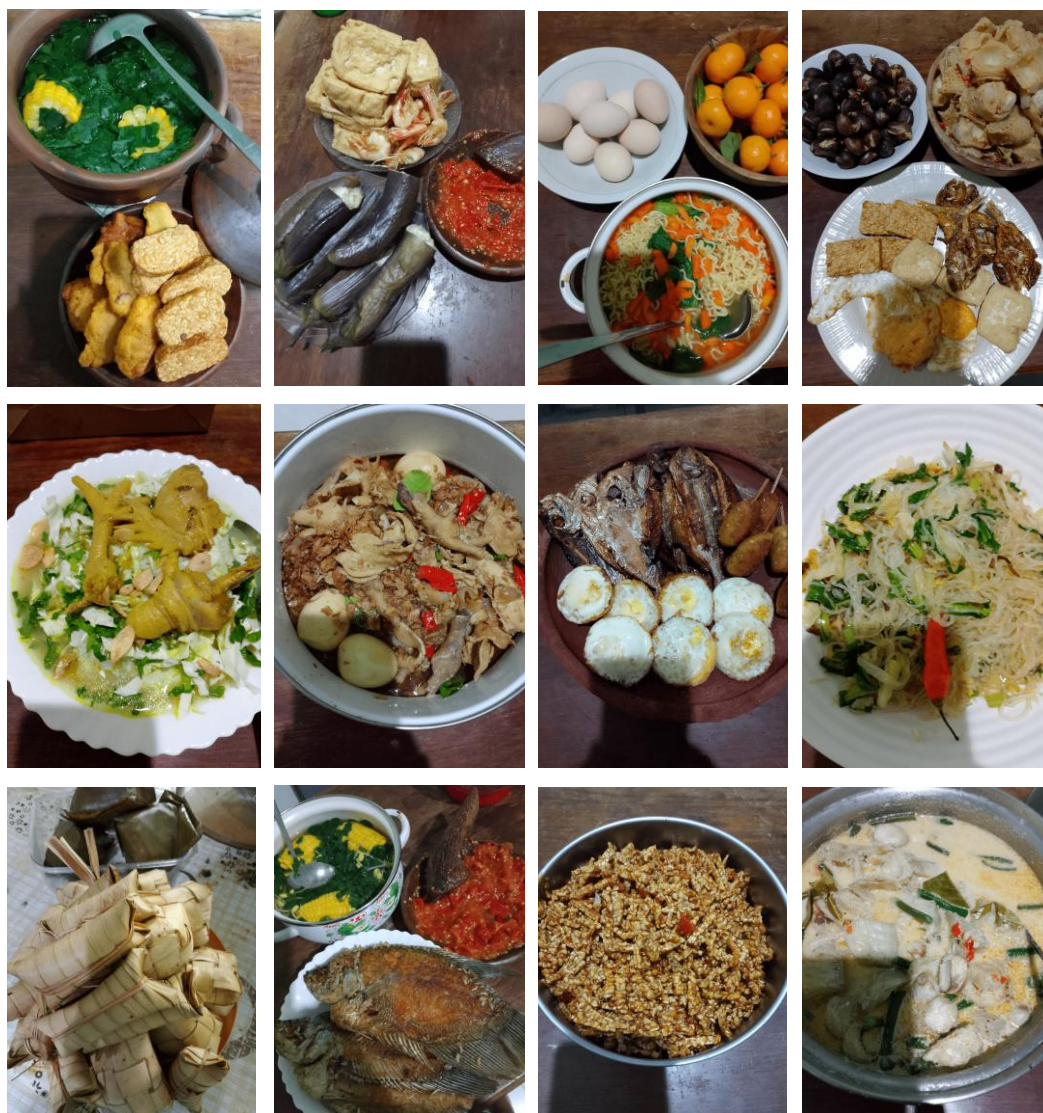
Gambar 3. Dokumentasi Menu Makanan Sehat Sehari-hari dalam Sebulan

Dokumentasi menu makanan keluarga menunjukkan penerapan prinsip gizi seimbang dalam kehidupan sehari-hari, yang mencerminkan peran ibu tenaga medis dalam membentuk kebiasaan makan sehat di lingkungan keluarga. Secara keseluruhan, hasil penelitian memperlihatkan bahwa peran ibu tenaga medis sangat berpengaruh dalam membentuk pola asuh, gaya hidup sehat, dan pola konsumsi keluarga. Melalui kombinasi pengetahuan profesional, strategi pengasuhan yang adaptif, serta komunikasi yang efektif, ibu mampu mentransformasikan nilai-nilai kesehatan ke dalam praktik keseharian keluarga. Temuan ini menegaskan bahwa keberhasilan penerapan gaya hidup sehat dan pola konsumsi tidak hanya ditentukan