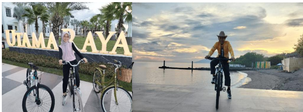
Gambar 1. Dokumentasi Liburan Keluarga

Penerapan gaya hidup sehat dalam keluarga terlihat dari kebiasaan menjalankan aktivitas fisik ringan secara rutin, pengaturan pola tidur, serta upaya manajemen stres yang dilakukan bersama. Keluarga membiasakan aktivitas fisik seperti jalan pagi, senam ringan, atau berkebun sebagai bentuk olahraga yang mudah diterapkan dan tidak membebani. Selain itu, keluarga juga berupaya menjaga keteraturan waktu istirahat dan mengurangi penggunaan gawai pada malam hari. Manajemen stres dilakukan melalui kegiatan rekreatif bersama, komunikasi emosional, serta aktivitas santai yang memperkuat kedekatan keluarga. Praktik ini menunjukkan bahwa gaya hidup sehat tidak dipahami semata-mata sebagai aktivitas fisik, tetapi juga sebagai upaya menjaga keseimbangan fisik dan mental dalam keluarga.